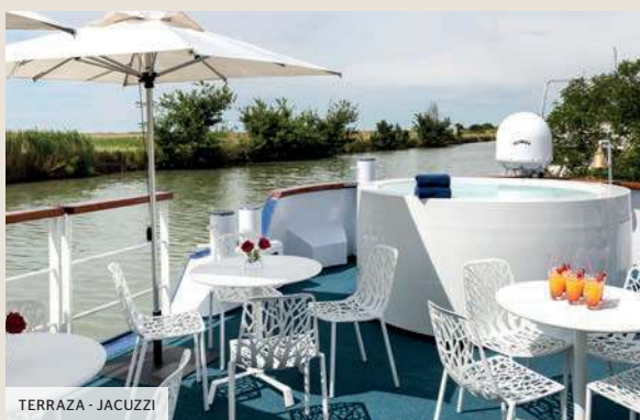
TERRAZA - JACUZZI

La MS Anne-Marie es un magnífico peniche de 5 anclas de confortables dimensiones. Mide 38,50 metros de largo y 5,07 metros de ancho. Tiene capacidad para 22 pasajeros alojados en 11 camarotes dispuestos en dos cubiertas. Cada uno de ellos, con una superficie de 8 m 2 (incluyendo un camarote para movilidad reducida de 11 m 2 ), tiene todas las comodidades y ofrece las mejores condiciones para la estancia en el barco. A bordo, todo está cuidado hasta el más mínimo detalle y los 6 tripulantes garantizan un servicio personalizado.