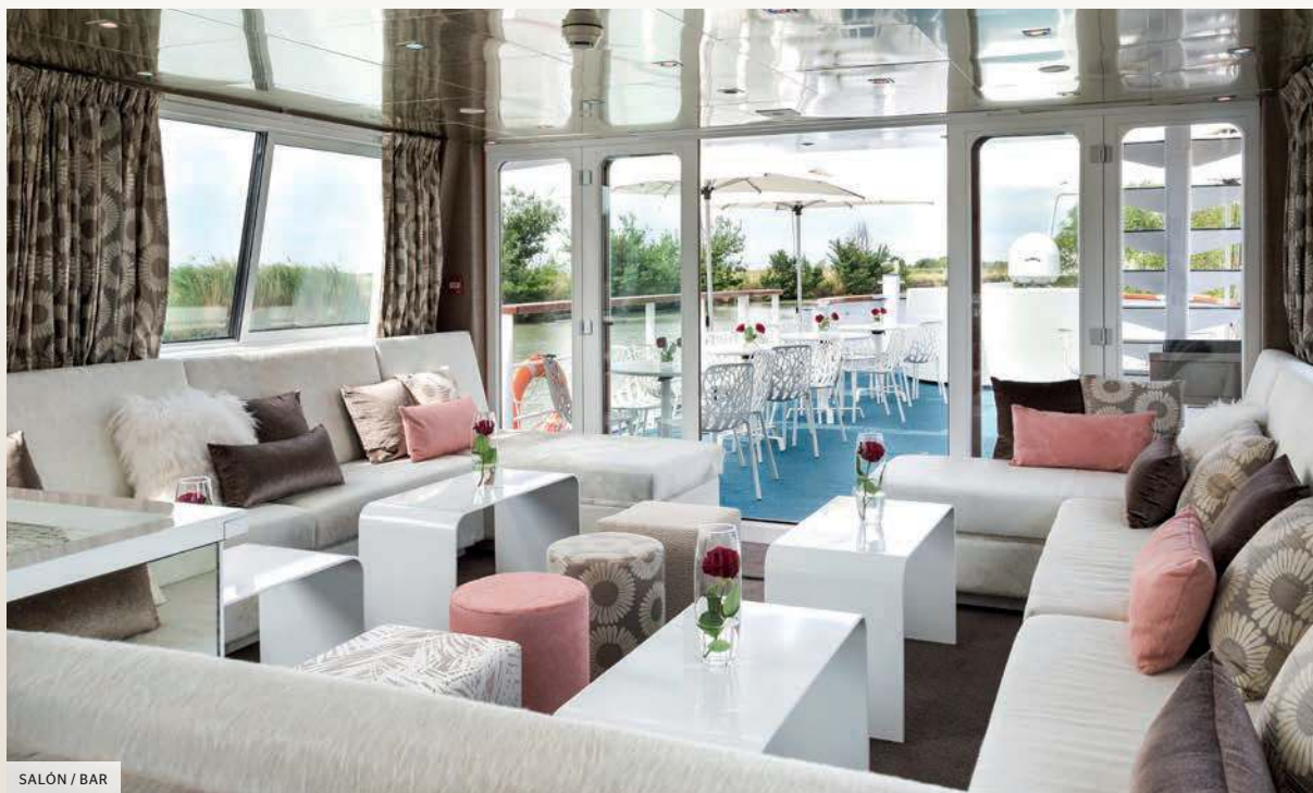
SALÓN / BAR

Un crucero a bordo de un Peniche es un paréntesis relajante para tomarse el tiempo necesario de descubrir la “duce France” de otra manera. El MS Anne-Marie, un acogedor y moderno barco con encanto, navega por los canales franceses y ofrece a sus pasajeros una experiencia original, emocionante y autentica.