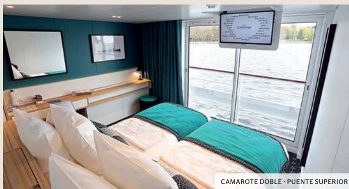
CAMAROTE DOBLE - PUENTE SUPERIOR

(1) PMR - Persona con Movilidad Reducida