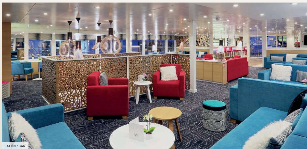
SALÓN / BAR

Los terciopelos y las imitaciones de pieles, mezclados con los colores fucsia y azul verde, realzan la decoración interior y consiguen un aspecto elegante y acogedor.