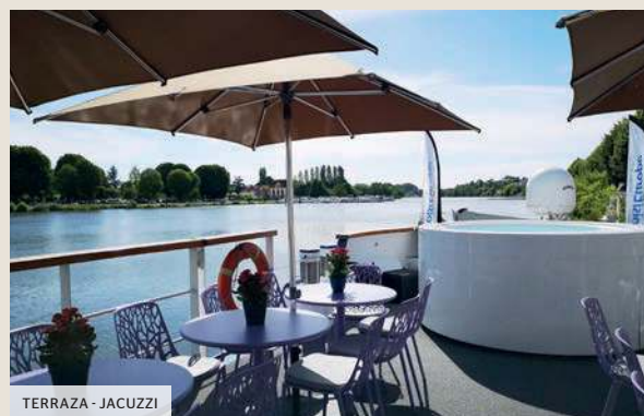
TERRAZA - JACUZZI

La MS Raymonde es un magnífico peniche de 5 anclas de confortables dimensiones. Mide 38,50 metros de largo y 5,07 metros de ancho. Tiene capacidad para 22 pasajeros alojados en 11 camarotes dispuestos en dos cubiertas. Cada uno de ellos, con una superficie de 9 m 2 (incluyendo un camarote para movilidad reducida de 11 m 2 ), tiene todas las comodidades y ofrece las mejores condiciones para la estancia en el barco. A bordo, todo está cuidado hasta el más mínimo detalle y los 6 tripulantes garantizan un servicio personalizado. La