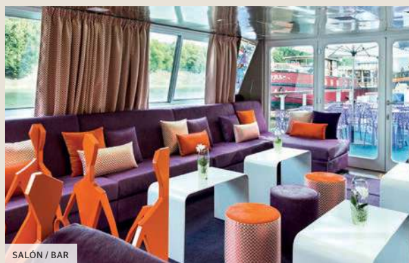
SALÓN / BAR